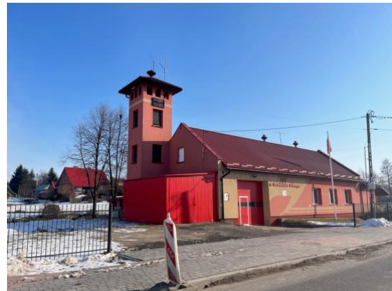
Fot. 8 Remiza OSP