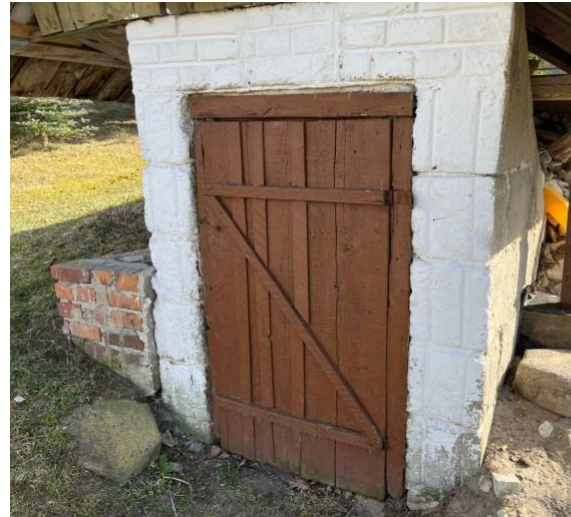
Fot. 6 Piwnice