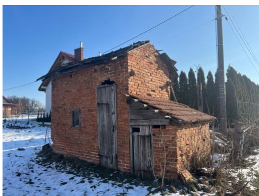
Fot. 1 Nieużytkowane suszarnie tytoniu

W dniach 10.02. i 18.02.2023 r. dokonano objazdu badanej powierzchni i jej najbliższej okolicy, na której odszukano i wykonano kontrolę obiektów nadających się na zimowe kryjówki nietoperzy. Starano się wejść do każdego atrakcyjnego dla nietoperzy obiektu, w którym poszukiwano nietoperzy. Jeżeli dostęp do obiektu był niemożliwy, inwentaryzację uzupełniano wywiadem środowiskowym. Kontrolą objęto obiekty stanowiące prawdopodobne kryjówki nietoperzy, takie jak: przydomowe piwnice, studnie, opuszczone budynki, murowane stodoły i inne zabudowania, kościoły. Na analizowanym terenie nie stwierdzono zimowisk nietoperzy. Kontrolowane miejsca przedstawiono poniżej (Fot. 1 - Fot. 8).