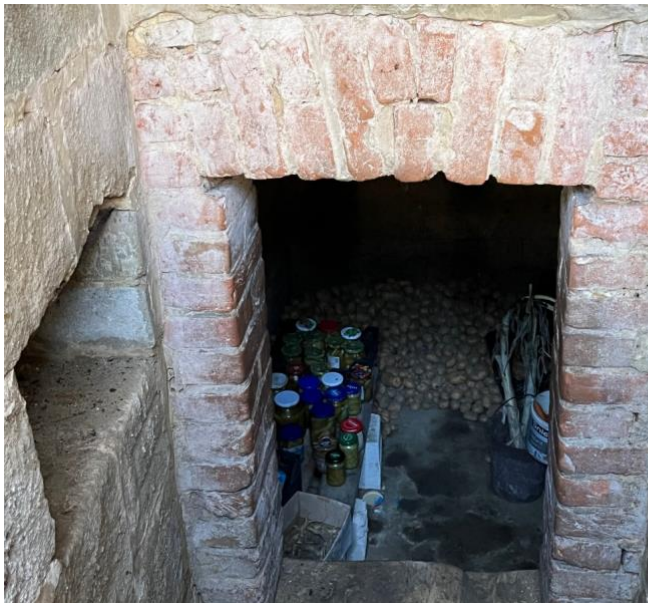
Fot. 7 Piwnica