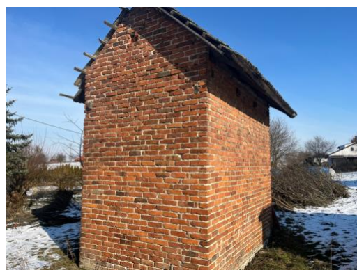
Fot. 2 Nieużytkowane suszarnie tytoniu