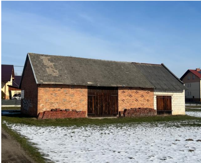
Fot. 5 Murowane stodoły