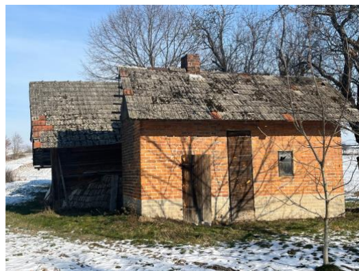
Fot. 4 Budynki gospodarcze