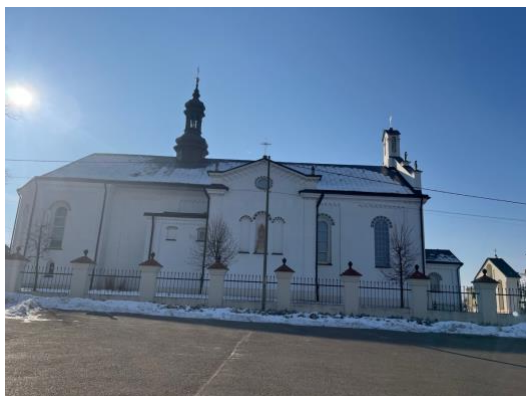
Fot. 3 Kościół rzymskokatolicki p.w. św Barbary